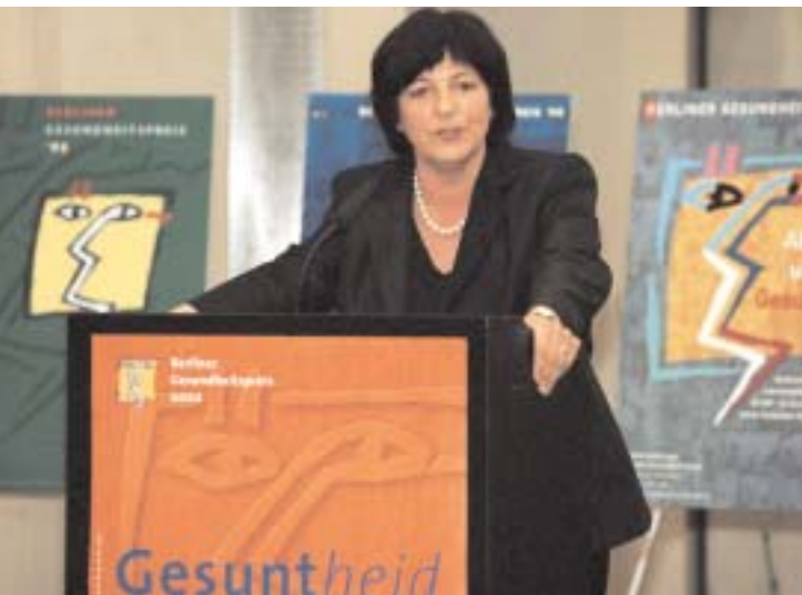
Beim Festakt in Berlin: Bundesgesundheitsministerin Ulla Schmidt gratuliert den Preisträgern.

Welchen Beitrag kann die Politik leisten, damit Behandlungsfehler seltener geschehen? Warum wird das Thema von so vielen Beteiligten als brisant empfunden? Über diese und andere Fragen sprach G+G mit Bundesgesundheitsministerin Ulla Schmidt.