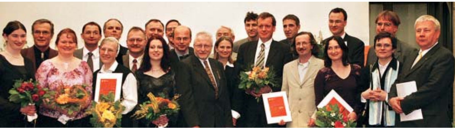
Viel gute Laune gab es bei der Preisverleihung des Berliner Gesundheitspreises 2002 in der Berlin-Brandenburgischen Akademie der Wissenschaften. Über 50.000 Euro – verteilt auf sechs Preise – konnten sich die Ausgezeichneten freuen.