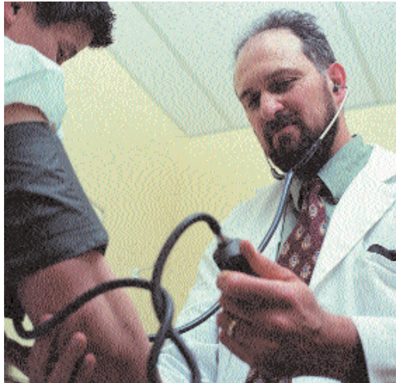
Wie können Hausärzte besser als bisher Pannen und Fehlern vermeiden? Kieler Wissenschaftler suchen nach Antworten.

Ziel war vor allem die Entwicklung einer ersten Fehlerklassifikation für die Allgemeinmedizin. Unter Beachtung strengster Sicherheits- und Anonymisierungsanforderungen wurden über einen Server der World Health Network Foundation (Stiftung des Weltgesundheits-Netzwerkes) in London insgesamt 172 Fehler beziehungsweise Beinahefehler aus deutschen Hausarztpraxen registriert. Mit dieser Meldequote trugen die offenbar besonders aufgeschlossenen deutschen Teilnehmer die höchste Zahl von Fehlerberichten zur internationalen Studie bei. Insgesamt konnten 601 Fehler aus sieben Ländern registriert werden. Erste Analysen haben gezeigt, dass 73,2 Prozent der berichteten